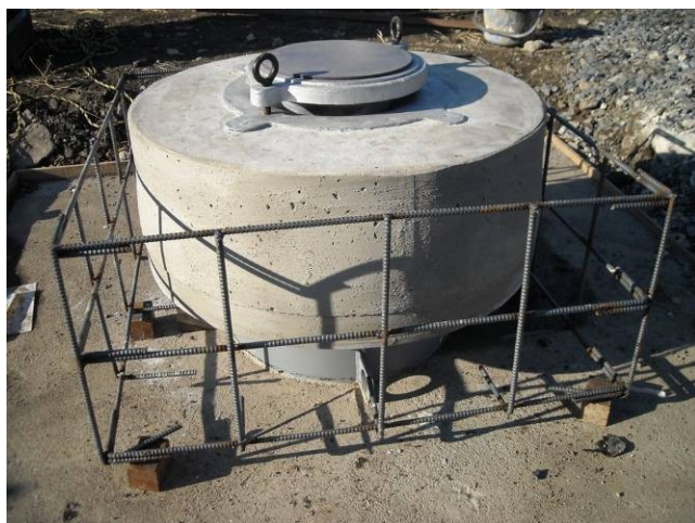
写真1 「BSL パイル」 施工完了状況